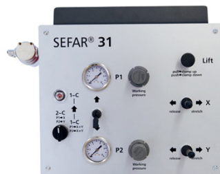
通用、人性化且紧凑的控制单元 与SEFAR 3A组合使用