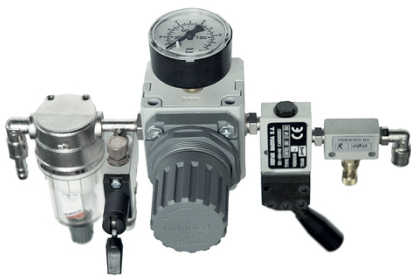
简单控制单元 与SEFAR 3A组合使用